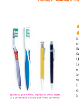
spacetris, puarmentinis, ognidun di chesti ojets al a une funzion clare ma une forme, une meccaniche un signor di produzion, (e ançes un pensil diferents çajâr dal design che al è stât progettât e di cui che al è destinât.)

1. Il termin design si scomece a doprâli in Americhe tor i agns vinci e al è rapuartari a la aziende plui di avanguardie dal timp: la Ford. Ce jerial succedût? In chei agns la Ford e produseve una machine, la Tin Lizzie, che si vendeve una vore ma che e jere nome di color neri. La Tin Lizzie e jentre in crisi co la General Motors, il concorin plui grant de Ford, si met a produci une Chevrolet une vore colorade. La Ford e capis. In mancûl di un an e met in cumierç machinis plui comudis e elegantis e in plui colôrs. Al è nascût il design!