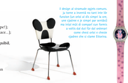
il design al stramude ojets comuns. ju torne a inventâ no tant inte lôr funzion (un orlo al dis simpri la ore, une çjadree e je simpri par sentâsi) ma intal miôr di comparâ cun formis a volis dal dut fôr dai ordenari come chest orlo e chest çjadree che si clame Etorina.

6. ce isal il design In cuatri peraulis, il design al à di dà a un ojet chestis cualitâts: - rispundin a une dibissune (par un curtis, chê di taiâ); - podê jessi doprât in maniere juste (il curtis nol a di vè la lame de bande che si lu çjape!); - podê jessi produsût e metût in vendite (par esempi: il curtis nol a di vè il mani di glace...); - al à di rispundin al sens estetic di cui che lu comprè. Di plui, a nivel di marçjât, si domande ançe che ce che al ven produsût al vedi di jessi sutignibil, ven a stâi, al à di vè un impat ambientâl baç, ançe cuant che si lu produsû. Si che: - a an di jessi doprâdis risoris che si puedin rinovâ; - il cicli de sò vite al à di jessi otimizât; - si à di straçjâ il mancûl pussibil. Come che si pues ben capi, il conceit di design no si ferme nome ae forme o a la utilitât di un ojet ma al çjape dentri dut il cicli de sò produzion.