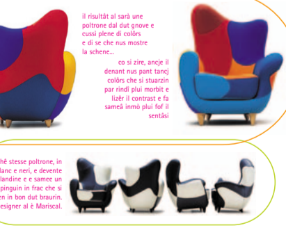
il risultât al sarâ une poltrone dal dut gnove e cussî plene di colôr e di se che nus mostre la schene... co si zire, ançe il demant nus pant tancj colôr che si stuarzin par rindî plui mortâl e lize il contrast e fa samei inno plui fof il sentâsi

ven classificate in trê fatis: la Maroc , la Marsilie e la Marburg . Insieme a chestis si produsin ançe çjadreis che si plein, "di biraric", onoradis cul prescât COMPASSO D'ORO A IGNOTI di Bruno Munari. Il COMPASSO D'ORO al è il piul impuartant premi di design talian e al ven dât de Associazione per il Design Italiano. Ma la vere ave dal design par excellence e j'è la çjadree Thonet nr. 14, che e salte fûr dai esperiments che Michel Thonet al innamân dal 1830 su len pleât cul vapôr. Cheste çjadree in nome cuarente agns, prin de fin dal secul, e vignârâ vendidute in passe 50 milioni di tocs. Dopo de seconde vuere mondiâl, a scomençin a zirà lis imagins plenis di otimismo dal benist american: formis curvis, fofis, plasticis che e 'fasin tindince' ançe ca di nô.