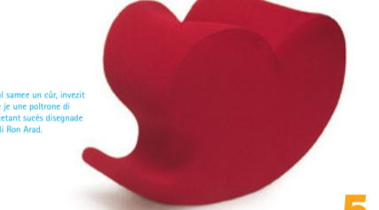
al samee un cûr, invèiz e j'è une poltrone di cetant sucès disegnade di Ron Arad.

4. design e disen Design par furlan si tradûs cun disen. Ma chest nol rive a di dute la complessitât fate di cualitâts esteticis e tecnicis di un ojet e il sò sul marçjât. Design, in efets, nol è nome la semplice representazion grafiche di une idee, ma al è la conseguente di une progettazion. Ce vuelial di progettâ. Cheste perale e salte fûr dal latin proiectare , compunde di pro , devant, e iactare , butâ. Un conceit che o podin tradusi cun libertât in 'anticipâ cul pînir'. Inta chest câs, pensâ denant tra la realizazion di un ojet par sodisfâ una funzion, un plasê, un desideri.