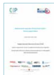
Modello-tipo di cooperativa ID-Coop / Modelltyp der ID-Coop Genossenschaft D.4.02