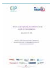
Report Risultati Indicatori & Selezione Aree Comuni / Bericht Ergebnisse, Indikatoren & Auswahl der Gemeindegebiete D.4.01