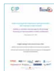
Guida ai requisiti giuridici richiesti per la cos- tituzione/modifica delle cooperative / Leitfaden zu rechtlichen Anforderungen für die Gründung/An- passung von Genossenschaften D.5.01