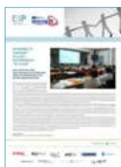
Newsletter (I, II) D.2.05