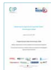
Manuale sul funzionamento delle cooperative in Italia ed Austria / Handbuch zur Funktionsweise von Genossenschaften D.5.02