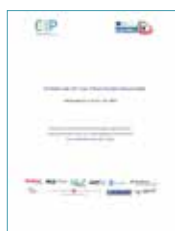
Studi e Set Indicatori Tematici / Studien und Set Thematischen Indikatoren D.3.01 & D.3.02