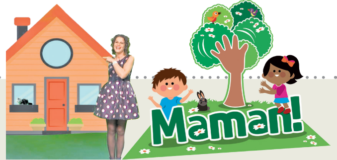
Projet promovût di 'Il Friuli' e 'ARLeF'