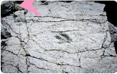
IMAGJIN GJAVADE FÖR DI WWW.PARCODOLOMITIFRIULANE.IT

Il Friûl al è il teritori in Europe là che a son stâts cjatâts plui fossii che di altris bandis. Un esempli a son lis olmis dai dinosaurs che a an passe 200 milions di agns e che a son stadis cjatadis inte zone tra Claut, Andreis e Cimolais. Voaltris vêso mai viodude la olme di un dinosaur?