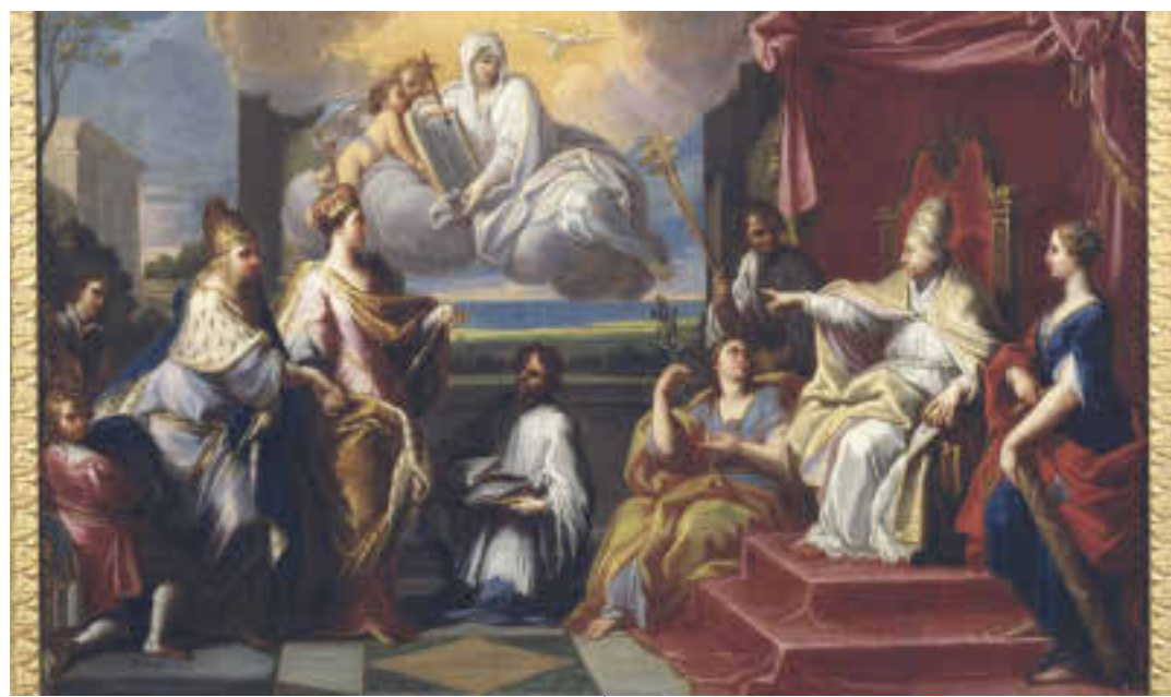
La alegorie dal Patriarcjât, cun Vignesie che lu lasse al Pape

I sis di Lui dal 1751, daspò di tantis amabilis conversaziions cui rapresentants de Imperadore Marie Taresie, de Serenissime e de Sante Sede, il pape Benedet XIV, "Servo dei Servi di Dio", al dave fûr une bole, la Injuncta Nobis, dulà che al decideve cussì: «O soprimin e o butin jù, inte citât e inte Glesie di Aquilee, di plante fûr, dal dut e par simpri, la catedre patriarcjâl, la dignitât, la sede e il non, cun ogni dirit patriarcjâl, metropolitan e diocesan colegât fin cumò cu la Sede e il Titul, e cun di plui, il cjapitul de Glesie stesse, la dignitât, i cjalunis e lis prebendis, di mût che di cul indenant nol esisti plui un cjapitul di chê Glesie patriarcjâl, arcivescovil e catedral, e nissun Patriarcje, Arcivescul e Vescul di Aquilee, ni nissune dignitât o cjaluni a puedin fâsi fuarts cun chê Glesie, dal dut, di plante fûr e par simpri soprimude e disfate». Un lengaç pôc di Glesie, ma cetant autorevul. Une condane cence remission, une "damnatio memoriae" che e segnave la fin ingloriose dal Patriarcjât e dal rît patriarcjin, che al durave di "saeculorum". Cun cheste sopression, e la contestual erezion, cul "motu proprio" Sacrosantae Militanti Ecclesiae dal 1752, il pape si gjavave un biel pès sul stomi, par vie che il probleme di un Patriarcjât starlocj a miezis tra un podê temporâl sot di chel eclesiastic di Aquilee, e un Patriarcjât sot dal podê de Serenissime, i veve procurât di tant