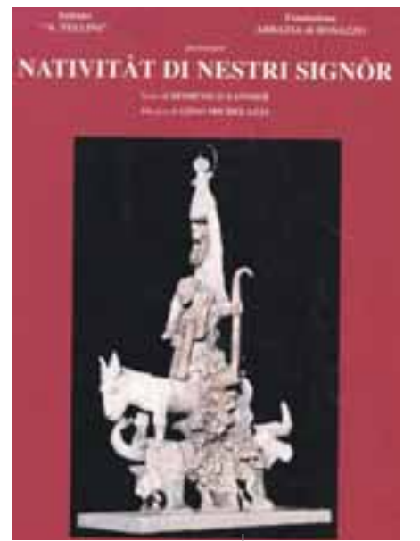
Il test de Nativitât

Cun cheste nassite, il proget de reden-zion a si fâs storie, incjamantsi te umanitât, e diventant promesse di riscat.