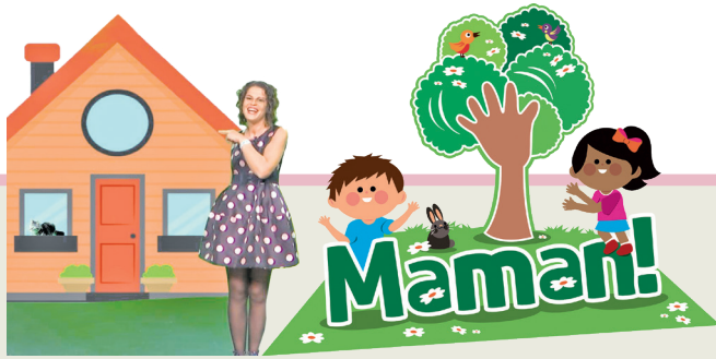
Proget promovût di 'Il Friuli' e 'ARLeF'