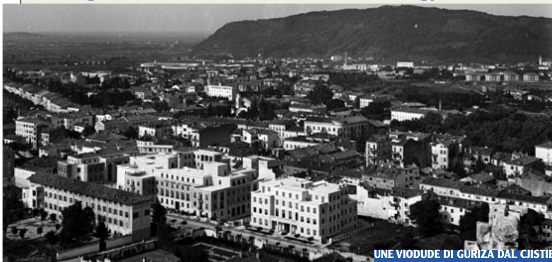
UNE VIOUDE DI GURIZA DAL CISTIEL INTUNE FOTO DI UGO PELLIS DAL 1940