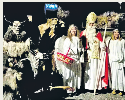
fate a Cjamparòs