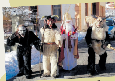
fate a Cjamparòs

■ A Cjamparòs, ai 5 di Dicembar, aes cinc sore sere e je la fieste dedicate a Sant Nicolau che, suntu saret, al ven puartât dai Krampus ator pal país e ator pes cjasis di duç i fruts. I Krampus a son personaçs mitologjics, che a somein a diauluts.