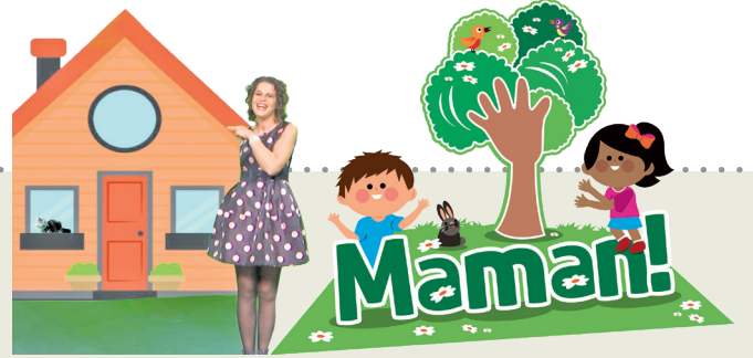
Progjet promovût di 'Il Friuli' e 'ARLeF'