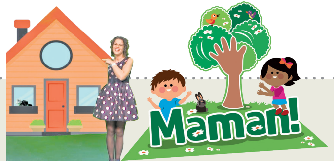
Proget promovût di 'Il Friuli' e 'ARLeF'