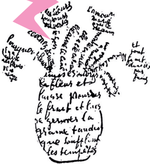
CALIGRAM DI G. APOLLINAIRE

Il caligram al è une poesie visive, o ben lis sôs peraulis e i siei viers a formin un dissen che al rapresente il teme de poesie. Se par esempi si fevele di un gjat, lis peraulis si disponaran sul sfuei propit a formâ un gjat. Il poete plui famôs in Europe che al à doprât i caligrams al è stât Guillaume Apollinaire.