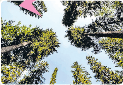
IMAGJIN GIADADE FÜR DI WWW.DISCOVERALPIGIULIE.EU

In Friûl al nas e al cres un arbul une vore particulâr che il so len si lu dopre par fâ struments a cuarde tant che lirons e violonci. Chest arbul al è il peç, e si lu cjate ancje inte Valcjanâl. Il len dai peçs al è elastic e al à la capacitât di sunâ; par chest al è definît "di risonance".