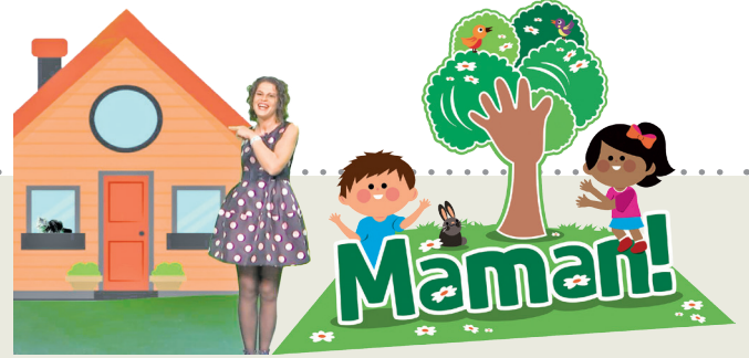
Proget promovût di 'Il Friuli' e 'ARLeF'