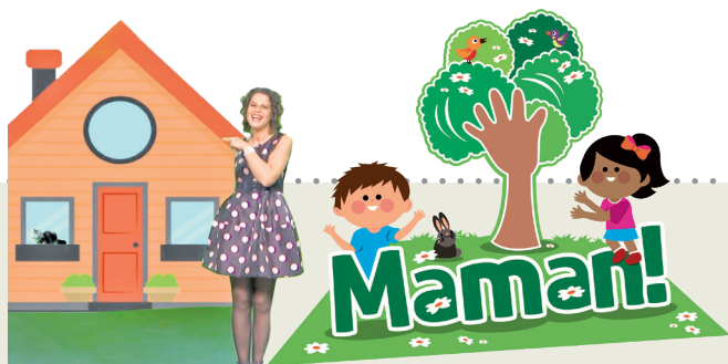
Proget promovût di 'Il Friuli' e 'ARLeF'