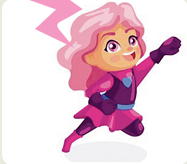
TIRITERE GJAVADE FÜR DI "99 PERAULIS, FEVELÄ CUL MONT", DI S. SCHIAVI FACHIN, FUTURA EDIZIONI.

Inte nestre regjon si fevele ancje la lenghe slovene. Provait a imparâ cheste tiritere: "Ringa ringa raja, kuža pa nagaja, muca pa pritecê, pa vse na tla pomecê". Par furlan lis peraulis si puedin voltâ cussì: "Ringa ringa raia, il cjan al fâs dispiets, il gjat al ven dongje e ju bute ducj par tiere".