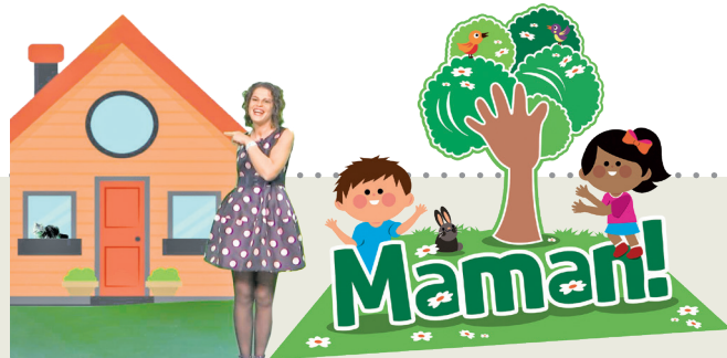
Projet promovût di 'Il Friuli' e 'ARLeF'

La zirafe e je l'animâl plui alt dal mont e cul cuel plui lunc, ma lu saveviso che e à ancje la lenghe... blu? Propit cussì: è je di chest colôr parcè che e à une sostanze organiche, la melanine, che le pare dai rais fuarts dal soreli de Afriche e che no le fâs scotâ. Cu la sô lenghe lungjone, di cuasi 50 centimetris, la zirafe e rive a sbregâ vie lis fueis tacadis tes ramacis plui altis des plantis, ma ancje a lavâsi i voi e lis orelis!