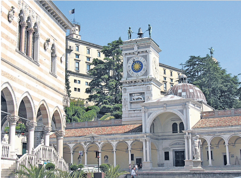
La Arlef e à ospitât a Udin il tierç incuintri dal progjet Interreg dedicât ai teritoris cun minorancis linguistichis. >> DI CHRISTIAN ROMANINI