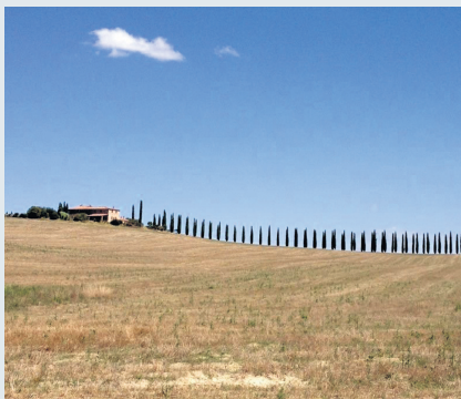
Toscana: "Sono nei (ci)pressi".