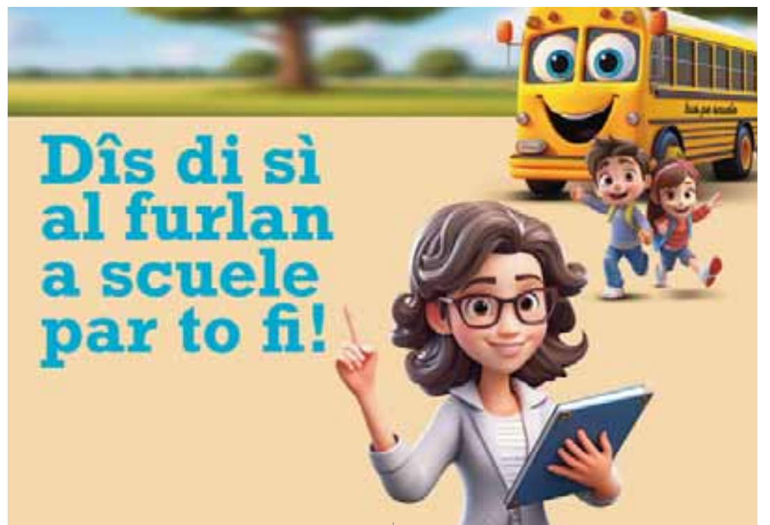
Une siele che l'an passât e je stade fate dal 79% des fameis

www.istruzione.it/iscriziononline (tal câs de scueele primarie e de scueele secondarie di prin grât) o