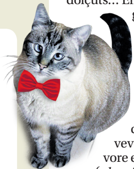
Fotografie di Vigji di Silvia Raber

Un siôr intun negozi di pomis: "O volarès vè un chilo di miluçs". "Ros, zâi, o verts?". E lui: "Nol impuarte, tant ju scussi".