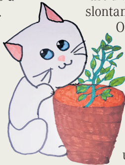
Dissen di Alessia di Blancjade

A àn non Mente, Osmarin e Basili. Cuant che o voi dongje di Mente, il