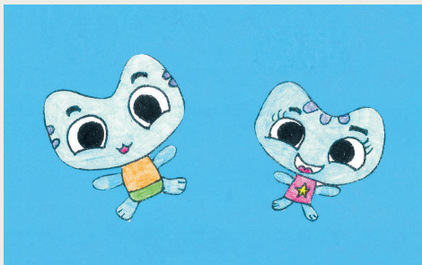
Il dissen lu àn fat i frutins de scuele primarie di Feagne

Cemût si clamino i doi gjatuts protagoniscj dal carton animât che tu viodis te transmission Maman! ?