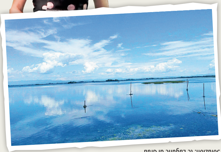
Soluzion: te Lagune di Grau