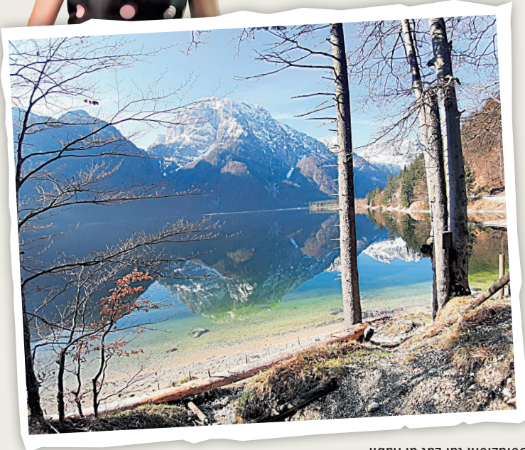
Soluzion: tal lâf di Rabil