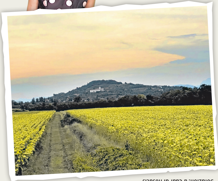
Soluzion: a Cuar di Rosacis