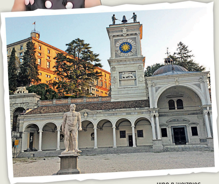
Soluzion: a Udin