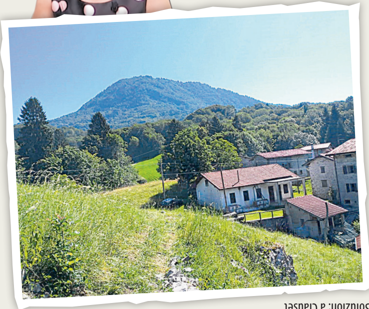
Soluzion: a Clausêt