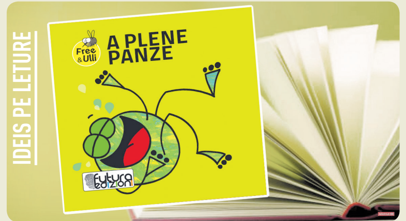
"Free & Ulli - A plene panze" - Patrizia Geremia - Futura Edizioni