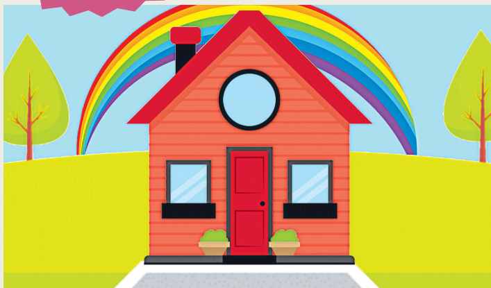
Soluzion: l'Arc di Sant Marc

Ce isal simpri parsore de cjasute dai tancj colôrs di Maman! ?