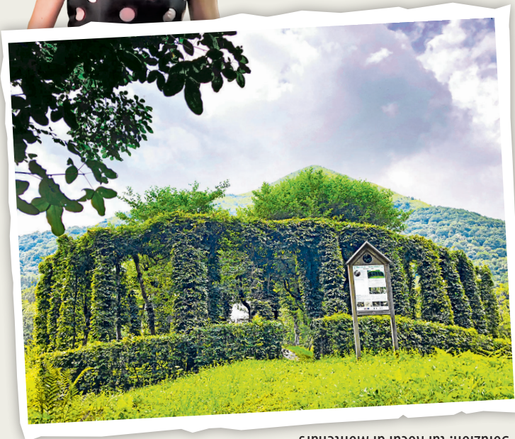
Soluzion: tai Rocui di Montenârs