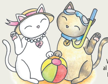
Lumi e Vigji

Progjet promovût di 'Il Friuli' e 'ARLeF'