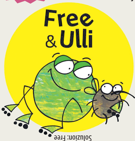
Imagjin gjavade fûr de golaine "Free&Ulli" (P. Geremia, Futura Edizioni, 2016)

Cui isal il crot? Free o Ulli? Cercililu cul colôr narançon.