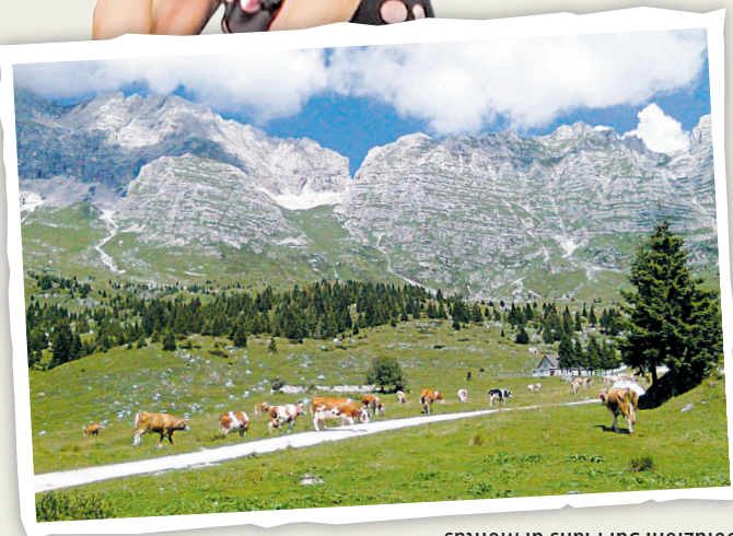
Soluzion: Sui Plans di Montàs