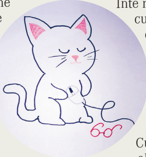
Dissen di Alessia di Blancjade

Ronfe ronfe! File file! Siere il voglut di ca, siere il voglut di là! E je ore di nanâ! Une bussade, Lumi