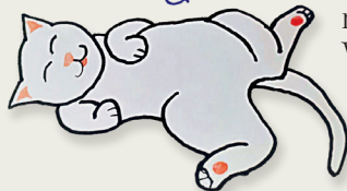
Dissen di Alessia di Blancjade