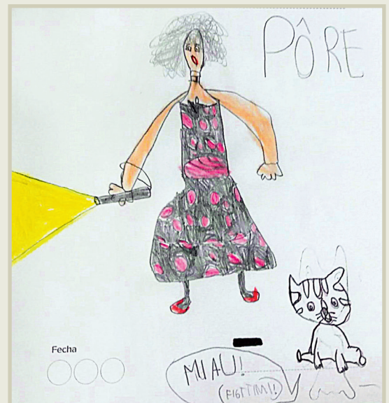
Il dissen al è di Joa (8 agns).

Mandinus un dissen che al conte di Maman! a maman@tvstar.com