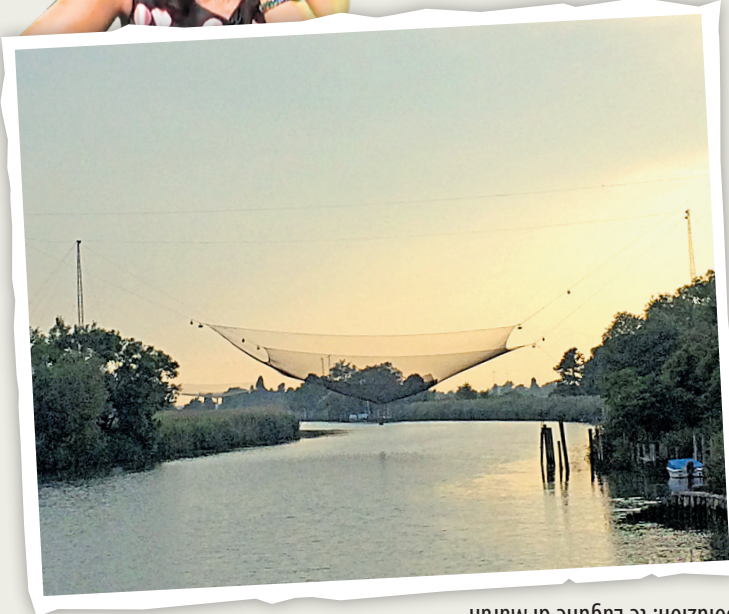
Soluzion: te Lagune di Maran