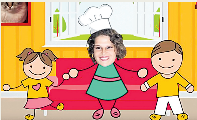
Soluzion: Master Cogo

Cuâl isal il non de rubriche de prime stagjon di Maman! là che Daria e prepare golosets?