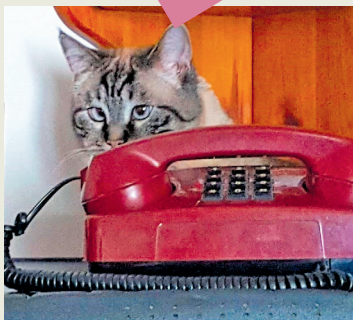
Fotografie di Vigji di Francesco Damiani

GNOVIS NOTIZIIS, INFORMAZIONS SU CUALCHIDUN O SU ALC