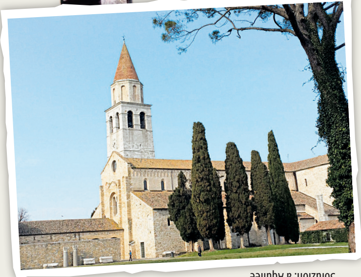
Soluzion: a Aquilee