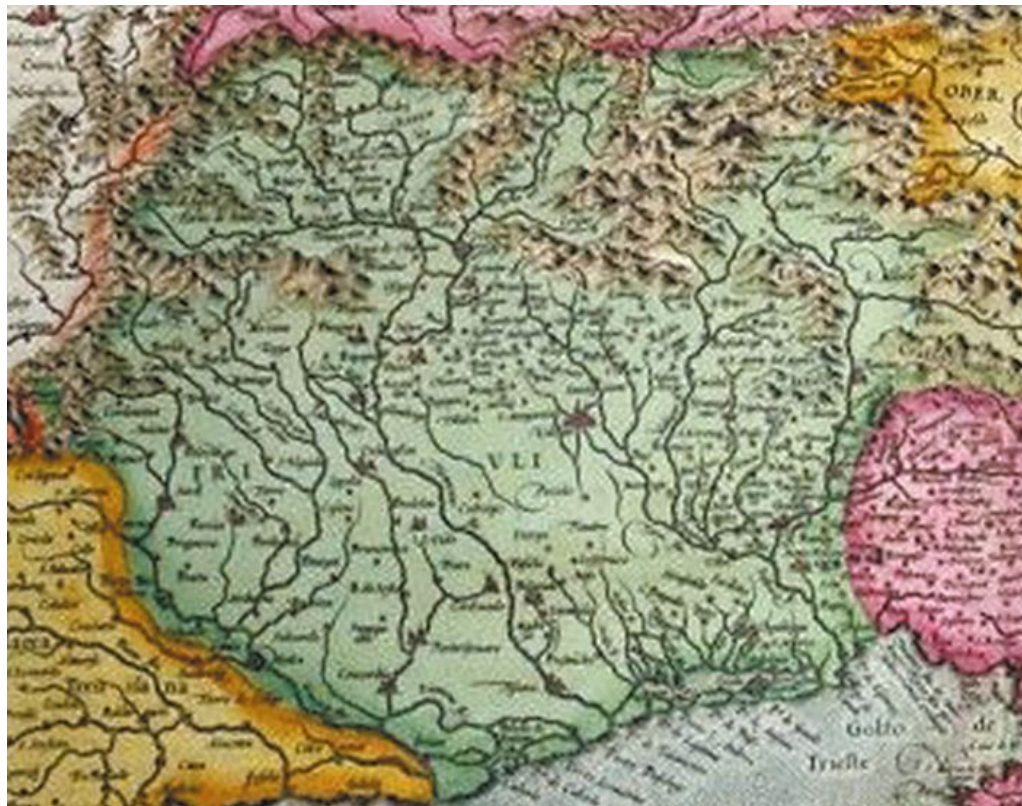
Una cjarde de Patrie dal Friûl gjavade fûr dal Atlant di Mercatore dal 1619

Fat al è che, dopo Pordenon, tai ultins agns in Italie a son spontadis tantis altris Provinciis, dispès inventadis e cence storie, par slargjâ la burocrazie e fâ mangjâ i politicants e duj chei che i stan torator. Cuanche al è saltât fûr il discors de lôr sopression, un citadin medi furlan al podeve duncje pensâ che, di une bande, al jere un pierdi di identitât storiche, ma di chê altre bande si podeve tirâ un su-