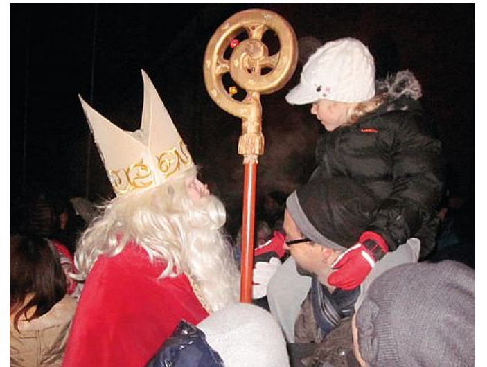
San Nicolau al torne pai fruts ogni an pai sîs di Dicembar