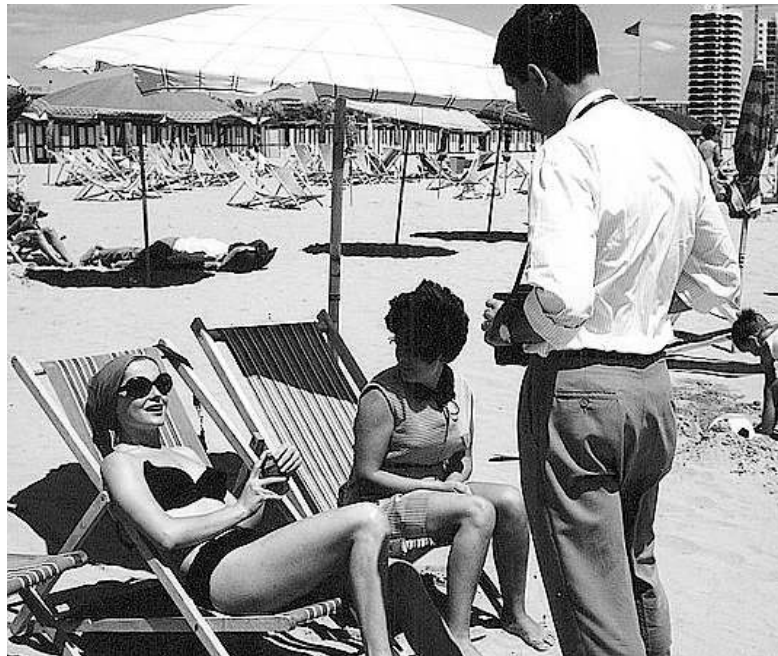
Virna Lisi e fevele cun Enea Fabris su la splaze di Pinede tal 1966