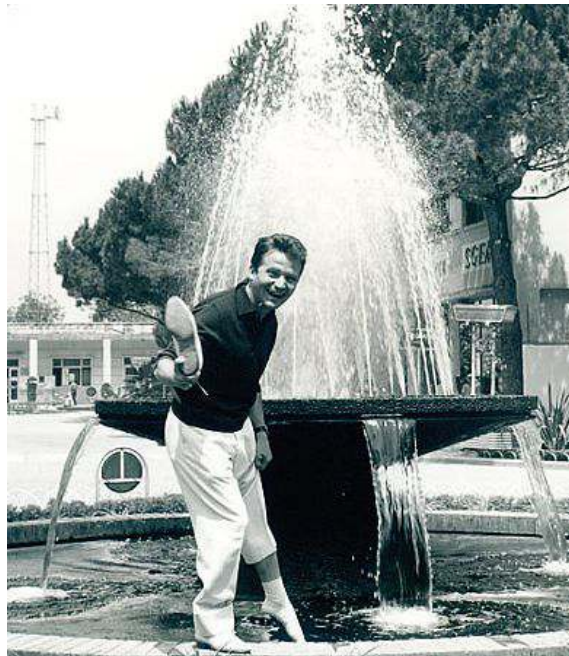
Alighiero Noschese a Lignan tal 1962