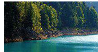
Il lât di Sauris

Viaçs pes monts e aghis dal Tiròl al Cragn ae Cjargne dai saurans