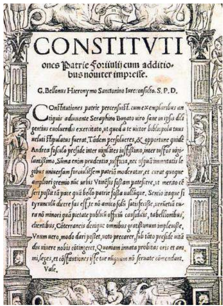
Un frontespizi e una cjarte des Costituzions de Patrie dal Friûl dadis fûr ai 8 di Novembar dal 1366 sot dal Patriarcje Marquart di Randeck (tal mieç)