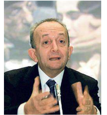
Tullio De Mauro

Marum pe pierdite di cuatri personaçs che a àn dât tant pe marilenghe