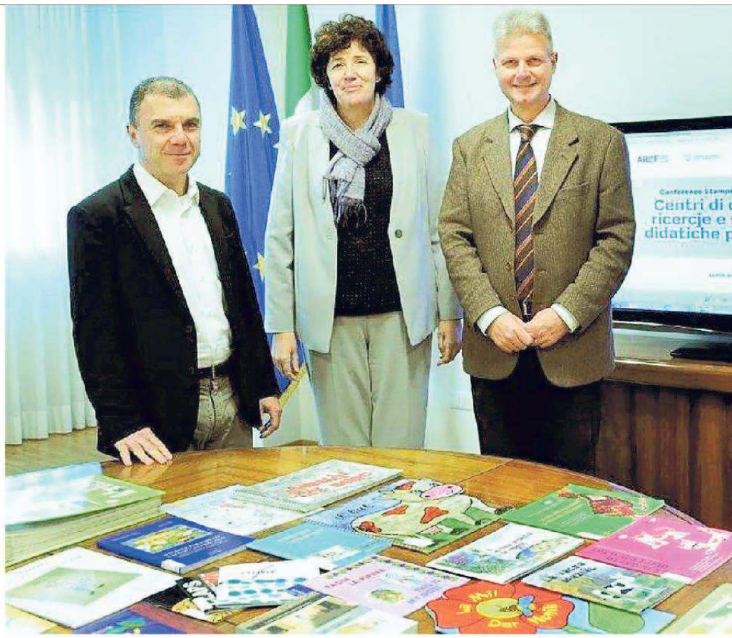
Fabbro (Arlef), la Assessore regionâl ae istruzion Panariti e Vicario (Filologjiche) pe nassite di Docuscuêles

A volè cun fuarce l'istituzion di cheste gnove struture – sburtâts de Regjon – a son stâts l'Arlef e la Societât Filologjiche che a àn firmât un protocol d'intese, mots de dibisugne di indreçâ i insegnants viers di une formazion continue, d'in-