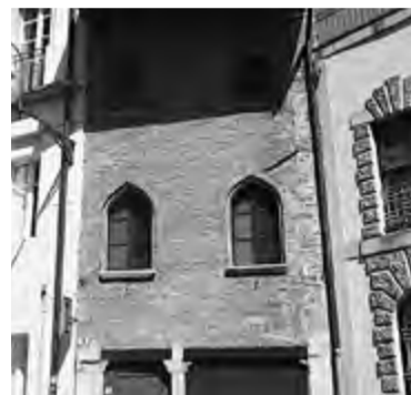
LA CJASUTE DAL TRESINTE DI VIA MAZZINI A UDIN