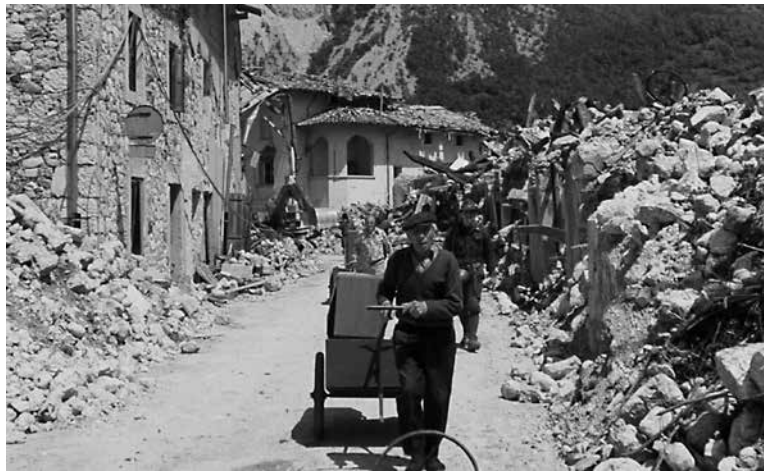
UNE IMAGJINE DAL DOCUMENTARI QUANDO LA TERRA CHIAMA DI MASSIMO GARLATTI COSTA (RAJA FILMS/ENT FRIÛL TAL MONT)

AL À FAT CAPÎ CHE PAR DUCJ CHEI CHE A JERIN IN CH'È VOLTE , grancj e piçui, il timp al pâr che nol sedi passât - che anzit, la emozion e la pôre e torne fûr come che al fos ir -, al è cjalant il documentari Quando la terra chiama di Massimo Garlatti Costa, prodot de Raja Films pal Ente Friuli nel Mondo , che si rindisi cont di trop che a patirin ançe i furlans pal mont. A rivin chei dis vôs cjapadis sù in Australie, Canadâ, France, Svezia, Italie, Lussemburg, Danimarce, Ingletiere. E lis peraulis a son misclâdis ançe aes lagrimis.