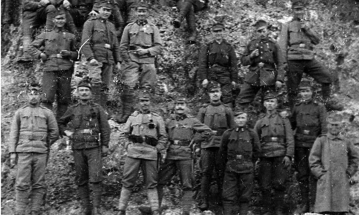
SOLDATS DAL "K.U.K. 7. INFANTERIE REGIMENT FREIHERR VON WALSTATTEN."

Al sta su la roste dal Ausse, il flum che al segnave il confin. Di une bande la Austrie, di chê altre il Friûl. Al sta in vuaite: il soldât cu la sô baionete no si môf, sculpît intun clap di Aurisine. Cu lis mostacjîs e il cjapiel asburgjic. Al ricuarde che di chel toc di Friûl, une volte Austrie, a partivin centenârs di zovins. Di pais tant che Strassolt, Çarvignan, a lavin a sglonfâ lis filis dal Vincjesim setim e dal Novantesim setim Reziment , cun destinazion Galizie. Atenzion: reziment muc, no talian. Di sabide ai 14 di Mai, chel monument no plui «ai caduti», ma «al soldât austrofurlan» al testemonee il lôr sacrifici te Prime vuere mondiâl. Lu à tirât sù a Çarvignan, chê volte austriache. Fis obleâts a une patrie che no sintivin lôr, ma che ur tocjave di ubidi. In ogni comun di Italie si ricuardin la vite dai miârs di zovins, «muarts par une Patrie». Ducj si visin di lôr: ma chei altris? Chei di là dal confin, si ben furlans? Lu volino di che a son simpri stâts ancje fis dismenteâts: de lôr stesse int e dai trombons celebratîfs dal Centenari dal conflit , dal fint mit che simpri al compagne la Grande Vuere ? Cussî, su chê pierre, ancje la dediche e à il so sens: «Ai nestrîs soldâts dismenteâts», dongje de acuite di Cecco Beppe.