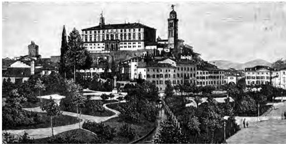
PANORAME DI UDIN CUL CJISTIEL, UNE DES SEDIS DAL PARLAMENT

Il Parlament de Patrie dal Friûl. Storie de plui antighe assemblee legislative di Europe 1228-1805. Bielzà te seconde part dal titul di chest libri si à la rispueste a une des domandis che dispès si fâs in cont di cheste istituzion: ma il Friûl aial vût pardabon il prin Parlament european?