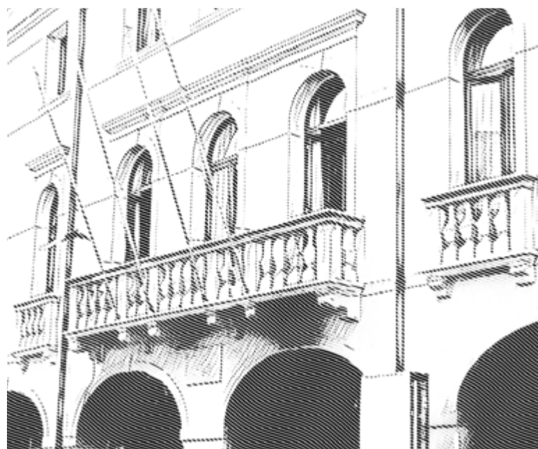
PALAÇ MANTICA, SEDE DE CJAMARE DI CUMIERÇ DI PORDENON

Pordenon al à pôre de invasion. Dai imigrâts? No, di chei di Udin... Le à clamade “anesion” i soestants “made in Pn”, la decision di Rome di fondi lis dôs Cjamaris di Cumierç di ca e di là da l'Aghe. Une leç sbaliade, une falope di chês nassudis intor de riforme istituzionâl che il Guvier Renzi al voleve fâ buine e che i talians a àn refudade votant cuintri ai 4 di Dicembar passât. Ma se la leç che e veve di cambiâ la Costituzione e je muarte in che volte, cheste altre norme di “semplificazion” no: e va indevant istès, metint cuintri teritoris fradis come chei di Udin e Pordenon e lant a stiçâ un marum che cierts ambients “vip” dal Friul Occidentâl no àn mai platât.