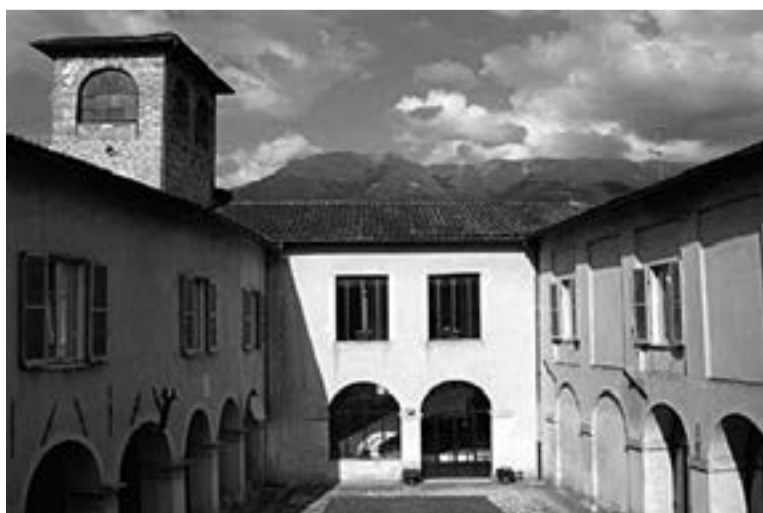
L'OSTEL CAPISTERIUM DI NORCIA PRIME DAL TARAMOT

Passât il moment dal polvar e des maseriis, si scomence cul dâ une man te prime emergjence e subit dopo si va indevant contant i dams e pensant cemût tornâ a fâ sù. Te grande tragjedi ancje noaltris o vin cirût cualchi contat e, midiant di Radio Francigena www.radiofrancigena.com , la radio uficiâl de Vie Francigena e "voce dei cammini", come che si clamin lôr, o vin cognossût il câs dal Ostel Capisterium di Norcia (PG) ( www.norciaspialita.it ) uns 40 km dal epicentri di Amatrice, prime tape dal Troi di Sant Benedet ( www.camminodibenedetto.it ) che de citadine umbre al rive a Montecassino dopo passe 300 km a pît. L'ostel al è gjestit di zovins de cooperative Monte Patino che a vivin di cheste ativitât.