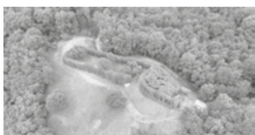
IL ROCUL DI PRE CHECO

Il rocul di Pre Checo Placerean a Montenârs al deventarà un parc leteari dedicât propit al storic plevan autonomist dal picul paîs prealpin. Il recupar dai rocul cun finalitât turistiche e di promozion dal teritori al è un dai tancj progjets che l'Ecomuseu des aghis dal Glemonàs al sta puartant indenat. A Montenârs, une volte a jerin passe 60 rocul che lis fameis a dopravin par