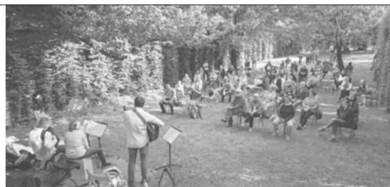
CONCIERTS TAI ROCUI

cjapâ i ucieluts e tirâ indenat la economie familiâr. In di di vuê, a son passâts sù par jù 20 agns de leç che e à vietât chê pratiche e di rocul a 'nd è restâts dome cuatri: chel di Manganel, chel di Spizzo, chel dal Puestin e chel di Pre Checo. Par valorizâju, l'Ecomuseu al à pensât ben di metiju in rêt midiant di un percors che ju coleghi, e a ognidun i à assegnât un rûl precis: cussì, se chel di Pre Checo al devente un parc leteari dedicât aes sôs oparis, chel di Spizzo al deventarà un pont di osservazion de faune dulà che si podarà anje restâ a durmî, chel di Manganel al varà un rûl museâl cu la pussibilitât di visionâ i imprescj di una volte, e chel dal Puestin al