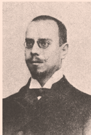
GIUSEPPE BUGATTO, DEPUTÂT TAL PARLAMENT AUSTRONGJARÉS. FAMÔS IL SO DISCORS DI AUTODETERMINAZION DAL POPUL FURLAN AL PARLAMENT DI VIENE AI 25 DI OTUBAR DAL 1918

❖❖ No podin sigûr fâ fente che la vuere in Ucraine no dedi une serie di problemis intrigôs ançe aes fuarcis che si riclamin ae autodeterminazion dai popui e al ricognossiment dai dirits des minorancis etnichis. Prin di dut, ce che al è daûr a sucedi al è la ultime dimostrazion che chei problemis no si decidin cul centralisim statalist, cu la afermazion dal plui fuart, ma cul ricognossiment dal dirit ae autodeterminazion, cun leçs che a fassin e che a metin in pratiche almancul un status diferenziât di gjestion, di decentrament aministratîf, di rispjet par lenghe e tradizions. Masse voltis o vin scrit che cheste Europe e je chê dai stâts e no dai popui, cu la consequence che lis sieltis politicis a vegnin imponudis in non dai singui interès, cul rinfuarçâsi di un volgâr nazionalisim, puartadôr di