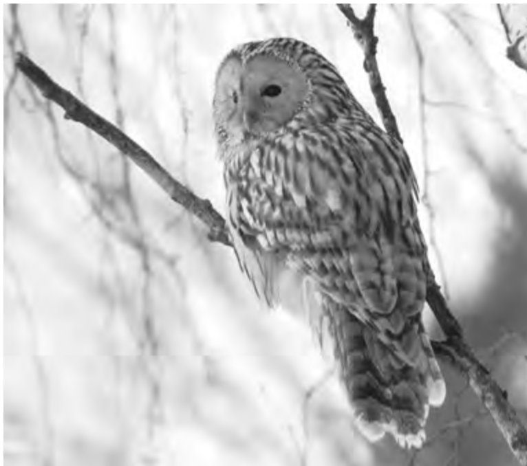
HABITAT DE BEGAROLE DAI URÂI SU LIS ALPS JULIIS

◆ In Italie, la Begarole dai Urâi e à tacât a nidiâ tai agns '90 dal secul passât, intes Vals dal Nadison. Intal stes periodi, e je stade cjatade ancje intal Bosc dal Cansei. Tai ultins 20 agns, l'autôr al à condusût studis par cjatâ la presince di popolazions in altris zonis, par verificâ la nidificazion, par definî l'areâl talian e la só evoluzion intal timp, par individuâ i aspjets leâts ae conservazion. Cun di plui, fra il 2013 e il 2018 a son stadis cjapadis in considerazion trê areis cul obietif di otignî valôrs di densitât tal periodi riprodutif. Lis trê areis, che a son rappresentativis dai habitats dulà che e vîf la specie a Sud des Alps, si cjatin ae estremitât nordorientâl dal Stât, ai confins cun Austrie e Slovenie in Comun di Tarvis, fra il Jôf dal Montâs, il Jôf