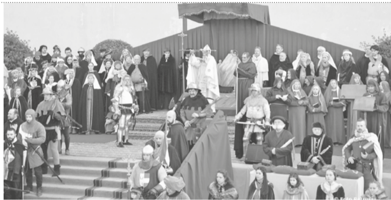
RIEVOCAZION STORICHE DE MESSE DAL SPADON

❖ La Messe dal Spadon e ven clamade cussì par vie de frecuente esibizion, intant dal so rituâl, di una spade: intal specific, e je la