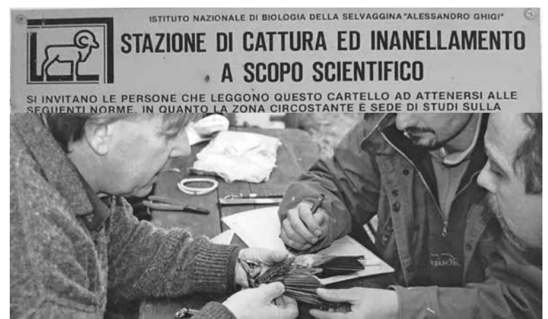
IL CARTEL Uficiâl E INANELLAMENT DAI UCIEI

Si pues informâsi su tantis iniziativas pal ambient tal sît dal Ispra, l'Istitût Superiôr pe Protezion e la Ricerche Ambientâl: www.isprambiente.gov.it/it . Par vè informazions sui roculi di Montenârs, e ancje par visitâju, lait sul sît dal Ecomuseu des aghis dal Glemonàs www.ecomuseodelleacque.it . ■